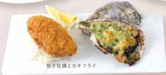
焼き牡蠣とカキフライ